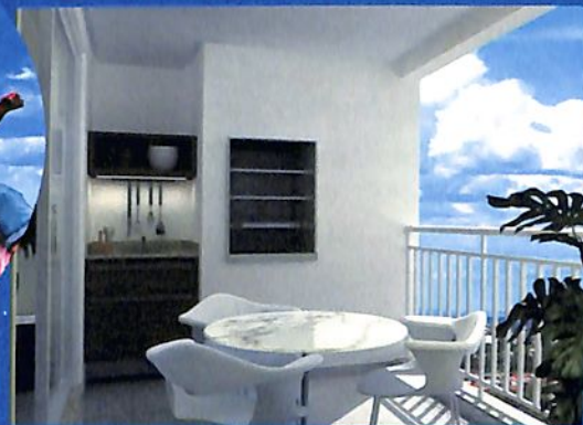
Sacada com churrasqueira