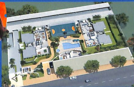
4.681m 2 de área total