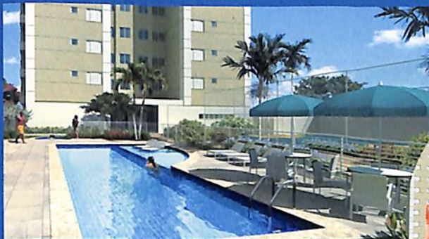
Piscina Adulto e Infantil